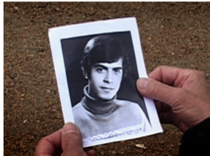
LEAVING BAGHDAD (al-Rahil min Baghdad)